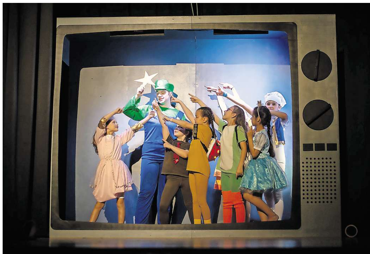
Träumer, Tänzer und Artisten präsentierten ihre Gala-Show unter dem Motto „Die große Filmmacht“.

Den Besuchenden bot sich eine lebendige Reise durch die Filme der Kindheit. Abgerundet wurden die beiden Shows durch köstliche Leckereien. Während der Pausen sorgte das engagierte Team der Träumer, Tänzer und Artisten e.V. am Samstag