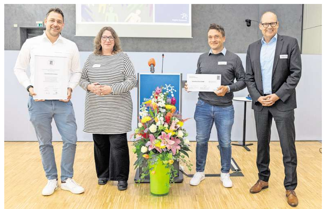
Preisübergabe an die Betreiber des E-Centers Christ und Schmidt in Seelze.

SEELZE. Menschen mit Behinderung den Zugang zum Arbeitsmarkt erleichtern und Chancengleichheit sichern – dafür setzen sich die Region Hannover und die Landeshauptstadt Hannover mit dem „Förderpreis für Inklusion in der Wirtschaft“ ein. Jetzt zeichneten sie erneut Unternehmen aus, die Inklusion im Arbeitsleben mit konkreten Maßnahmen voranbringen. Den Hauptpreis in Höhe von 10.000 Euro erhält das E-Center Christ und Schmidt aus Seelze. Es überzeugte die Jury mit einer langjährigen und gewachsenen Zusammenarbeit mit der Lebenshilfe Seelze. Menschen mit Behinderung arbeiten fest in den Teams mit, übernehmen verantwortungsvolle Aufgaben im Markt und stehen im direkten Kontakt mit Kunden und Kundinnen. Durch individuell angepasste Arbeitsplätze, gezielte Förderung und neue Aufgabenbereiche – etwa im Wareneingang oder in der Logistik – schafft das Unternehmen nachhaltige Perspektiven auf dem ersten Arbeitsmarkt. Die Jury würdigte insbesondere, dass Inklusion hier selbstverständlich im Arbeitsalltag gelebt und konsequent weiterentwickelt wird. „Mit dem