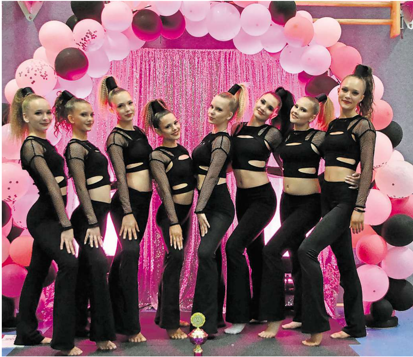
Das Foto zeigt die Smallgroup „Blackout“ - 2. Platz beim All Black Turnier.

Die Erfolgssträhne setzte sich bei den Rising Stars nahtlos fort.