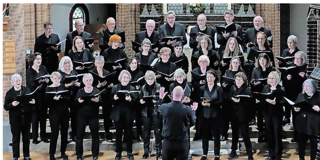
Der Kammerchor Schloß Ricklingen bei seinem Auftritt in der St.-Nicolai-Kirche in Hagenburg.