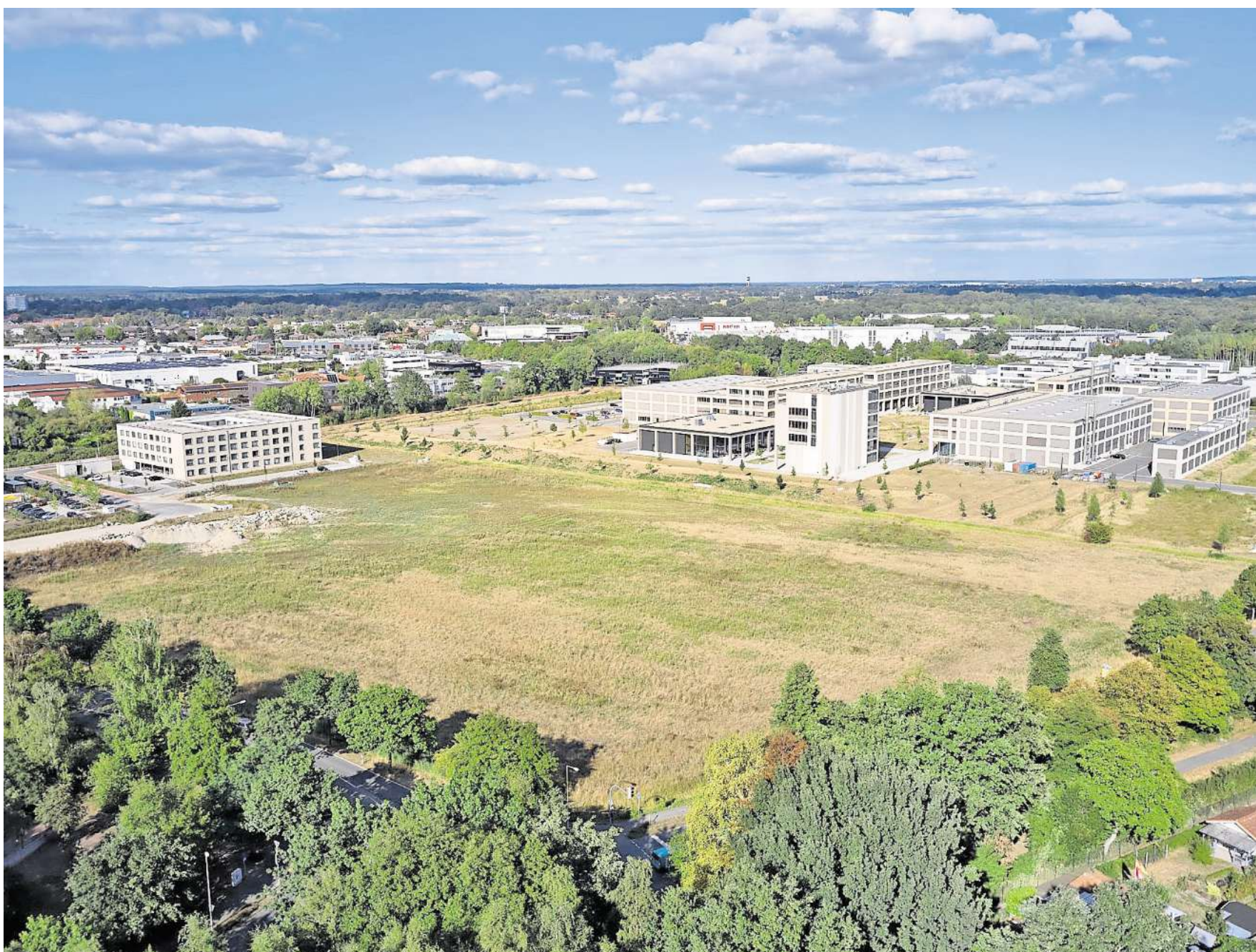
Mit dem ONE TechCampus Garbsen entsteht ein neuer Innovationsstandort für die gesamte Region Hannover. Das Projekt verbindet Wissenschaft, Unternehmertum und Technologieentwicklung und schafft attraktive Rahmenbedingungen für Gründungen, Forschung und unternehmerischen Erfolg.

GARBSEN. Am Pfingstmontag, 25. Mai, findet wieder der Deutsche Mühlenfest statt. Der ADFC radelt nach Steinhude, um das Mühlenfest an der Holländermühle Paula zu besuchen. Die etwa 48 km lange Strecke wird mit mittlerer Geschwindigkeit gefahren und führt naturnah über meist gut befahrbare Wege. Vor Ort können Getränke, Kuchen und Grillgut erworben werden. Eine weitere Einkehr ist nicht geplant. Start ist um 10 Uhr am Kastanienplatz in Garbsen. Eine Anmeldung per Telefon unter 0177 6737048 oder WhatsApp ist erforderlich.