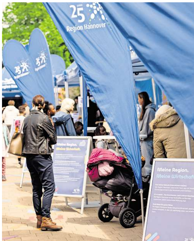
Die Regions-Roadshow kommt nach Seelze.

show ebenfalls besucht. Hier kann man am Sonntag, 21. Juni,