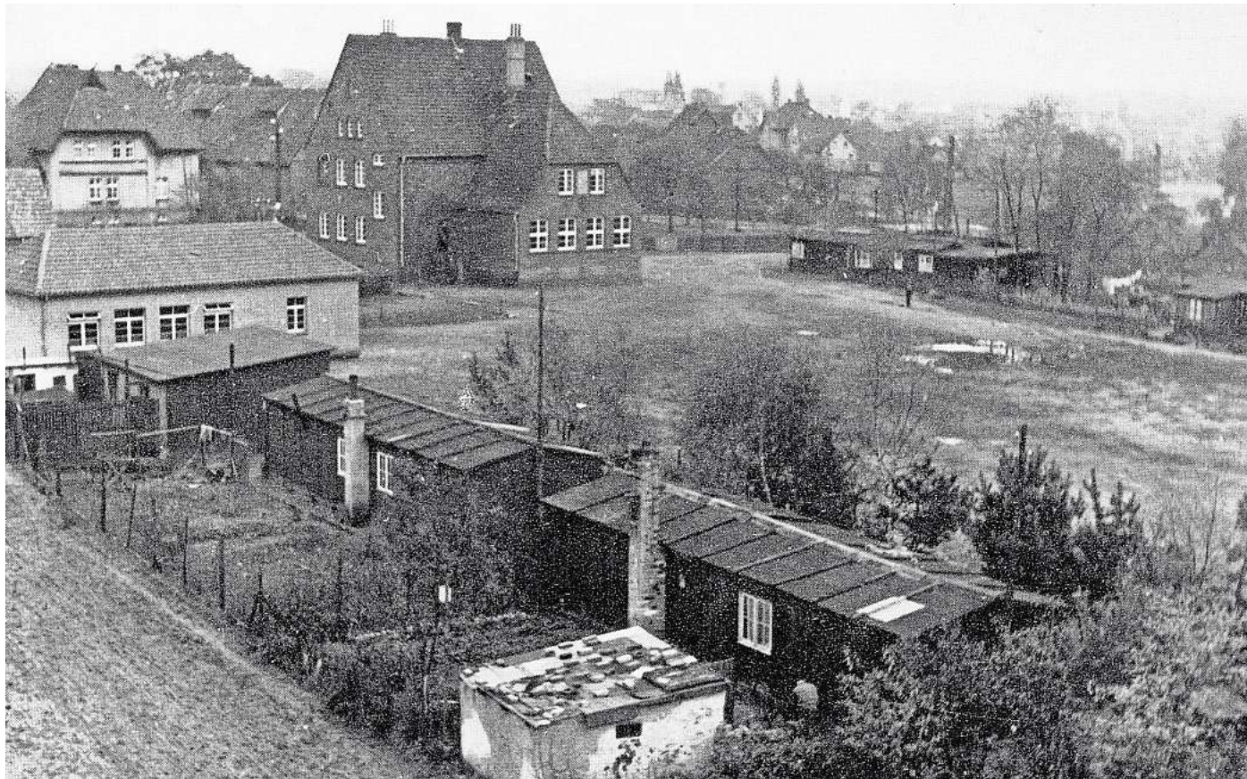
Das Foto zeigt den Osterberg mit Baracken aus dem Jahr 1951.

Zum 50-jährigen Jubiläum der Gebietsreform in Niedersachsen und der Stadt Garbsen in ihrer heutigen Form wurden in den Jahren 2024 und 2025 Rundgänge durch alle 13 Ortsteile angeboten. Die Veranstaltungen waren vielfach ausgebucht, zusätzliche Termine wurden angeboten. Die