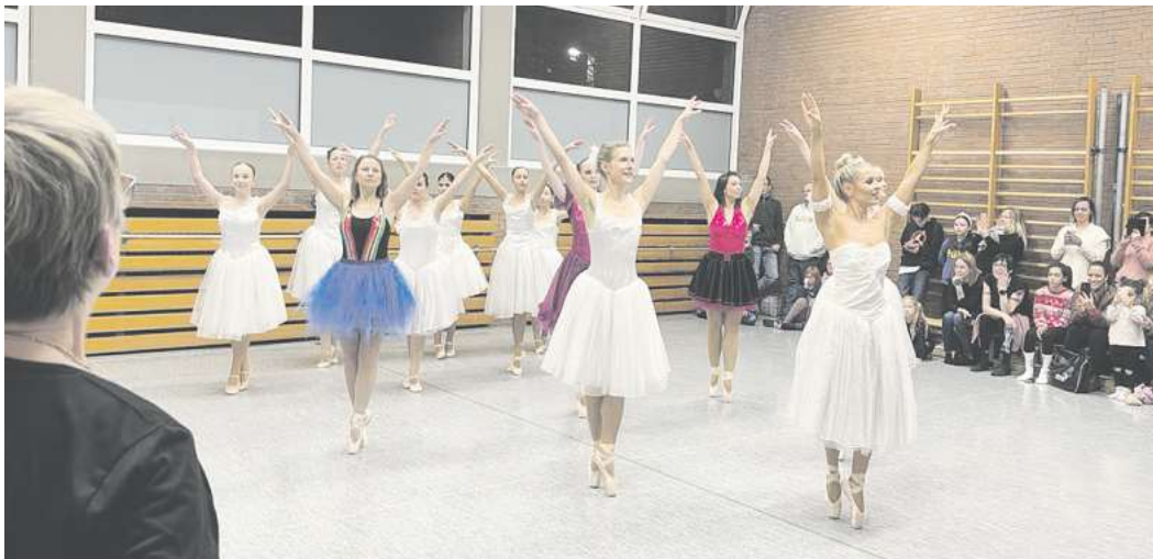
Die Gruppe der fortgeschritteneren Schülerinnen zeigte die Schönheit des Spitzentanzes.

GARBSEN. Die Balletttänzerinnen des Garbsener Sport-Clubs boten zum Jahresabschluss eine unterhaltsame Weihnachtsfeier in Form eines Live-Trainings. 35 Kinder teilten sich in drei Gruppen auf und zeigten, was sie im letzten Jahr gelernt haben. Dabei wurden die Choreos nach und nach aus einzelnen Abschnitten aufgebaut und im Anschluss zusammengeführt. Die Fünf- bis Achtjährigen zeigten schwierigere Fußstellungen und gelernte Schritte wie beispielsweise das Pas de Bourre. Der Tanz, den sie im Anschluss aufführten, wurde in hübschen Blumenkostümen getanzt. Die zweite Gruppe bis elf Jahre präsentierte schwierige Sprünge wie den Pas de Chat und einen Tanz mit schöner Musik aus dem Ballett Paquita. Der Höhepunkt der Weihnachtsfeier waren mehrere Tänze zur Musik