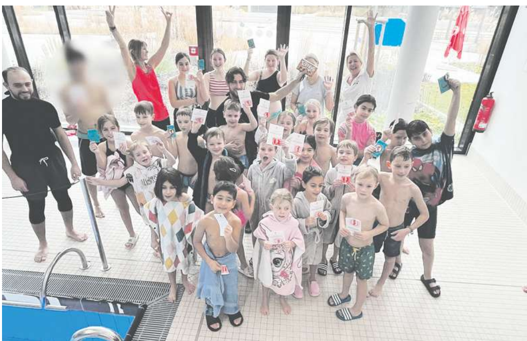
Stolz präsentieren die Teilnehmer ihre Schwimm-Abzeichen.