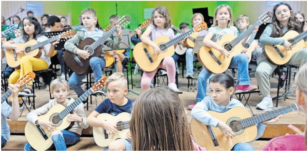
Den Gitarrenschülerinnen und -schülern war das Lampenfieber vor ihrem wohl ersten Konzert anzumerken.