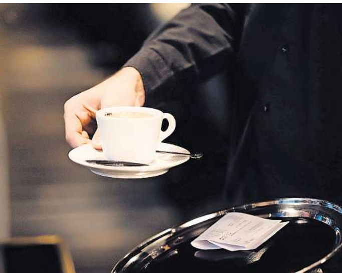
116.800 Mini-Jobber in Stadt und Region Hannover.