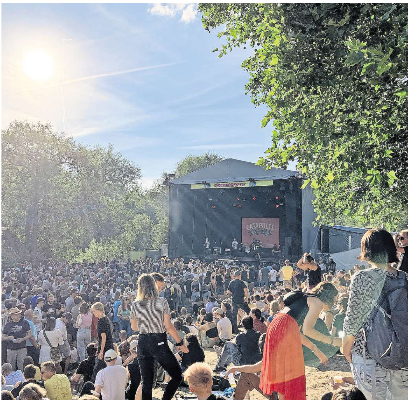
Feiern unter Sommersonne: Das Fährmannsfest lockt jedes Jahr mehr Besucher an.

Bleibt zu hoffen, dass es in diesem Jahr trocken bleibt, und das Fest wie geplant stattfinden kann. Im vergangenen Jahr musste der Sonntag ja wegen Unbespielbarkeit des Platzes