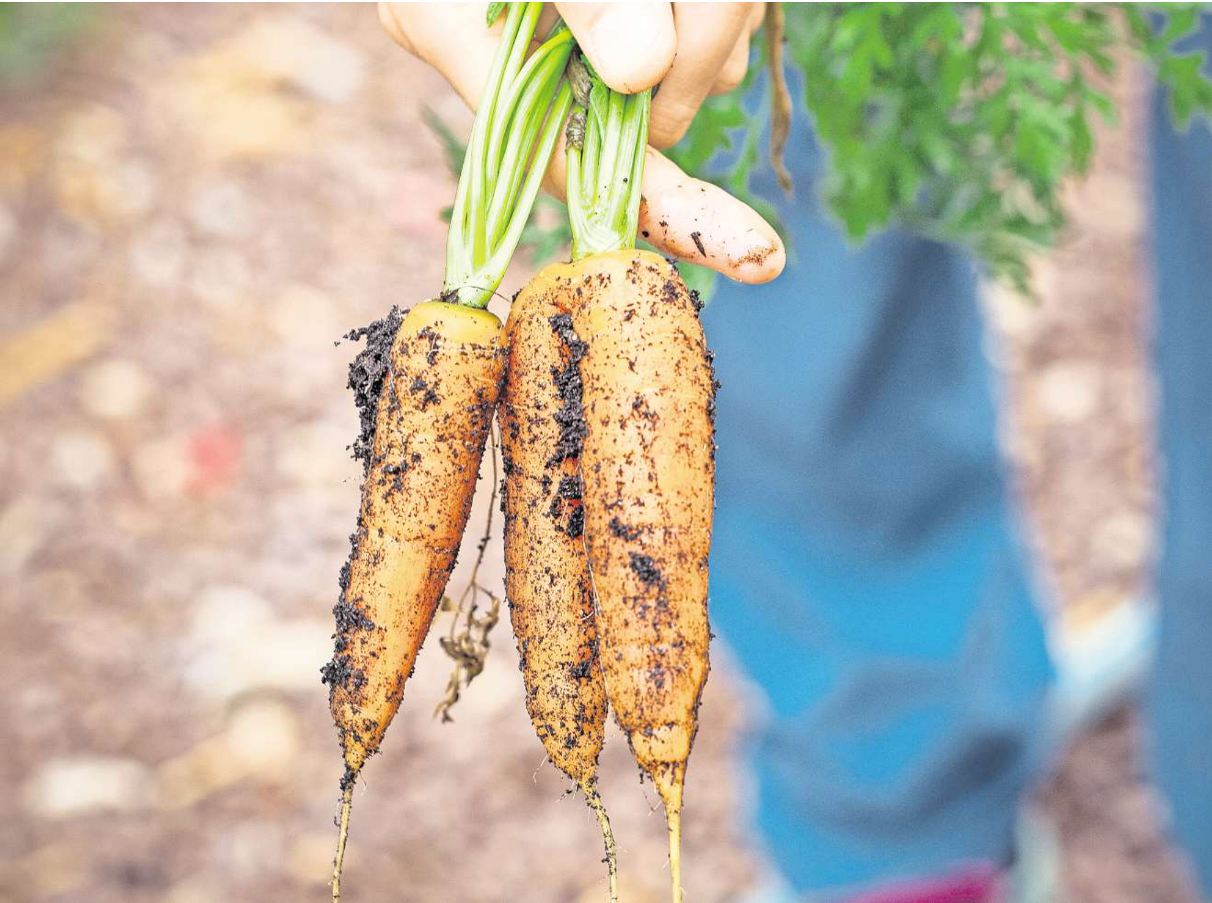
Flächenzuwachs und mehr Biohöfe: Der Ökolandbau ist weniger vom Strukturwandel betroffen als konventionelle Landwirtschaftsbetriebe.