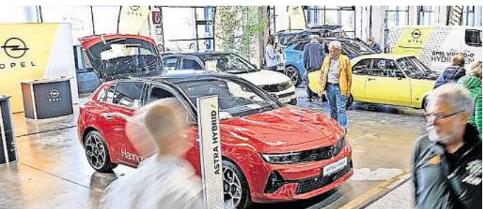
Alle Spielarten der Elektromobilität: Bei den E-Days auf dem Firmengelände der Madsack Mediengruppe können Besucher E-Autos und E-Bikes ausprobieren.

Haustür (Haltestelle August-Madsack-Straße). Über die Berneroder Straße können Besucher auch mit dem Auto zum Verlagshaus gelangen. Parkplätze stehen auf dem Gelände zwar zur Verfügung, aber ihre Zahl ist begrenzt. Mit dem Fahrrad gelangt man ebenfalls rasch zum Veranstaltungsgelände, etwa durch die Eilenriede und dann ein kurzes Stück auf dem Radweg an der Berneroder Straße entlang. Alle gängigen Elektroautomodelle können Besucher testen, etwa von Toyota, Renault, Opel, VW, Audi, Volvo und Mercedes. Neueste Modelle gibt es ebenfalls zu erleben, beispielsweise den ID 7 Tourer, den A6 e-tron und den Mercedes Van. Verschiedene Autohäuser aus Hannover präsentieren die Fahrzeuge, unter anderem das Autohaus Ahrens sowie die Autohäuser Günther und Kahle. Elektrofahräder aller gängiger Marken stehen zur