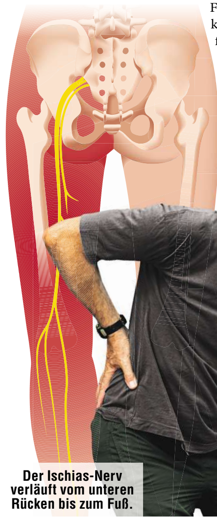
Der Ischias-Nerv verläuft vom unteren Rücken bis zum Fuß.

Das Beste: Die Schmerzmittel sind nicht nur wirksam, sondern zugleich gut verträglich und somit auch für die Einnahme bei chronischen Schmerzen geeignet. Nehmen Sie Ihre Schmerzen nicht länger in Kauf und fragen Sie in der Apotheke gezielt nach Restaxil!