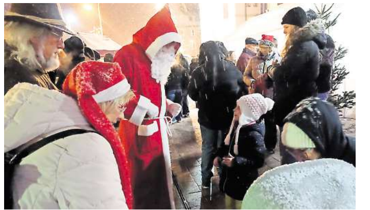
Natürlich kommt auch der Nikolaus auf den Weihnachtsmarkt in Letter: an beiden Tagen jeweils um 17 Uhr mit einem großen Sack an Obst und Süßigkeiten.

Die Männer der Schützengesellschaft Letter sind an den beiden Weihnachtsmarkttagen – wie auch an den Adventsfreitag an der HGS-Glühweinhütte – am Grill eingeteilt. Zusätzlich zu den leckeren Jende-Bratwürstchen gibt es beim Weih-