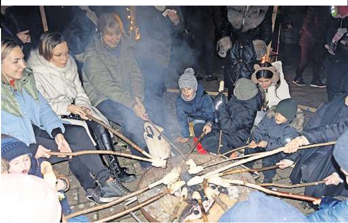
Dank der niedrigen Temperaturen konnten die Lohnders Pfadfinder immer wieder neue Gäste an ihrem Lagerfeuer begrüßen.

Das Nonplusultra war einmal mehr das ausgedehnte Höhenfeuerwerk zum Abschluss. Jeder Sternregen wurde von vielschichtigen Ah's und Oh's begleitet und der fulminante Schlussakkord mit anhaltendem Beifall begleitet.