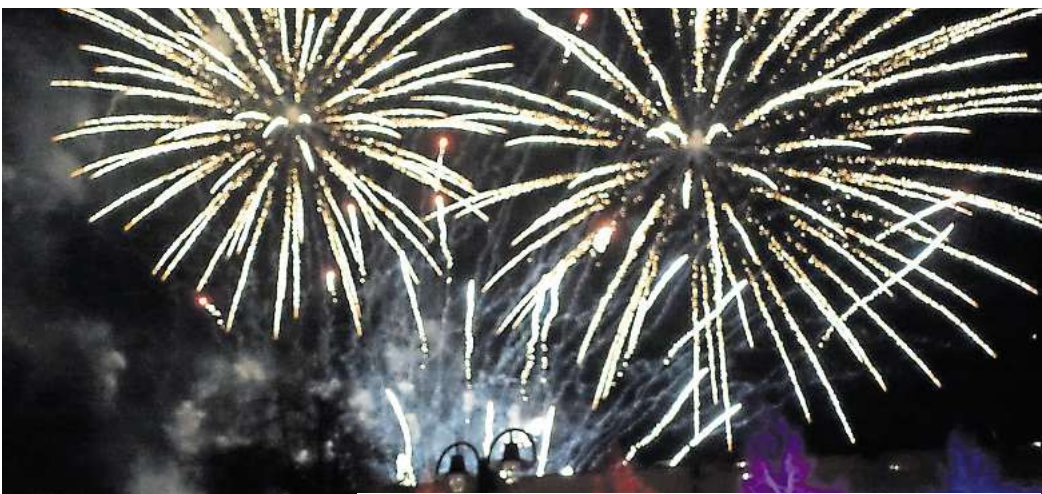
Böllers und Sternregen beendeten das spektakuläre Schauspiel am Himmel.

Zeit mussten die Besucher an den Verzehrständen mitbringen, die regelrecht umlagert waren. Das war man in den vergangenen Jahren bei der Schmalzkuchenbäckerei Stieg oder am Bratwurststand Kuhlow gewohnt, aber auch die Crêpes, die Burger oder die Norddeutschen Förtchen waren begehrt. Ähnlich war es bei der Schreibwarenhandlung Petri&Waller, die warme und kalte Getränke aus der Neustädter Sektellerei Duprés anbot. Auch die Feuer-