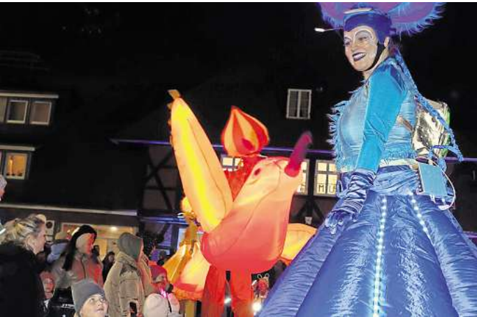
Ein Hingucker waren einmal mehr die Stelzenläufer in ihren leuchtenden Kostümen.