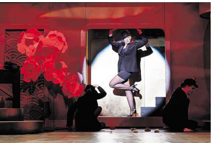
Die Aufführung „Unendliche Sterne“ lud zum Nachdenken, Mitfühlen und Zuhören ein.