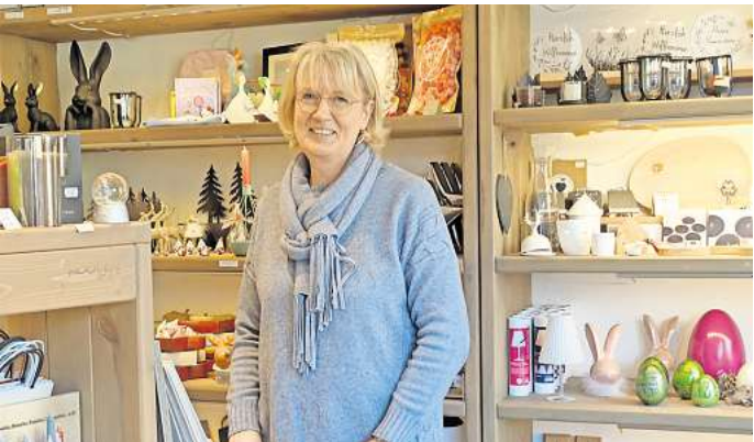
Es lohnt sich, im „Kleinen Haus der schönen Dinge“ von Meike Seifert zu stöbern.

(05031) 9394875 erreichbar, per Mail unter info@schlo-ri27.de .