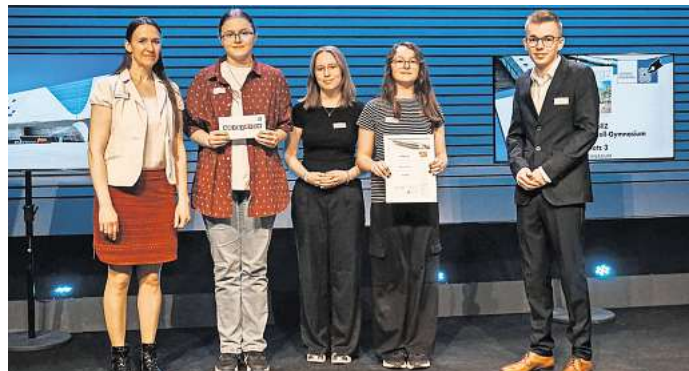
Den 3. Platz in der Schulform „Gymnasien“ und „Online“ (für alle Schulformen) belegte „Schollz“ vom Geschwister-Scholl-Gymnasium Berenbostel.