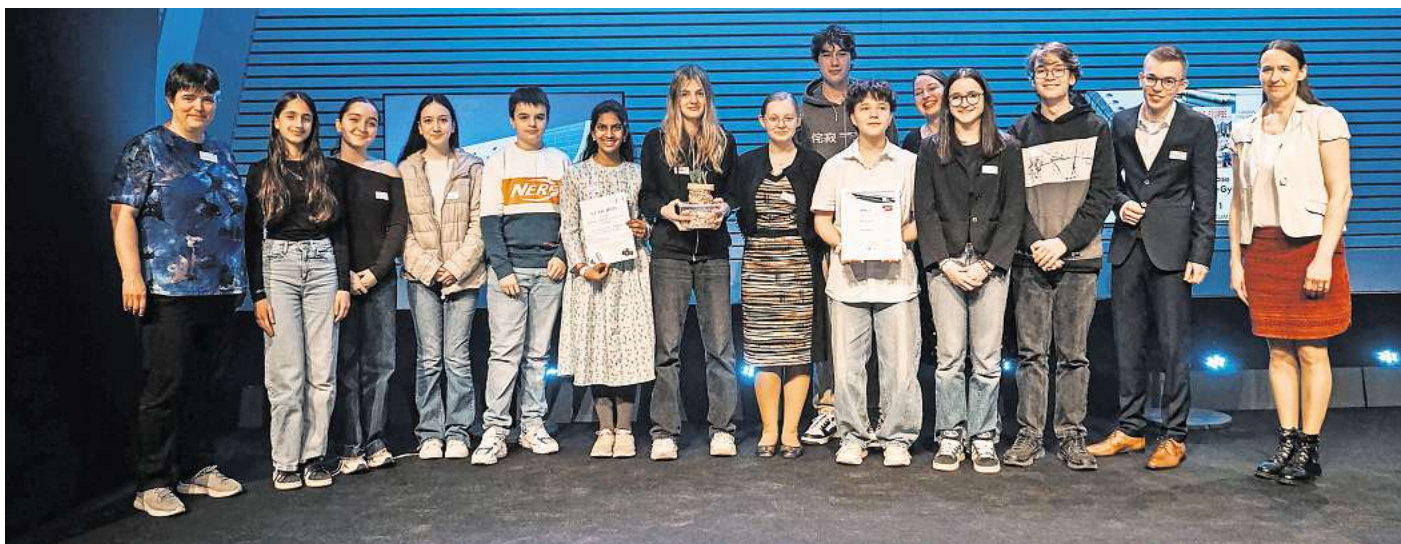
Den 1. Platz in der Schulform „Gymnasien“ belegte „Die Ellipse“ vom Johannes-Kepler-Gymnasium Garbsen.