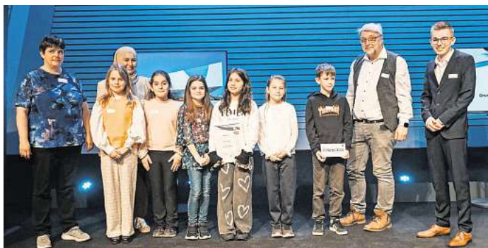
Den 2. Platz in der Schulform „Grundschulen“ belegte „Die Marienkäfer“ der Grundschule Marienwerder.

kationen aus dem gesamten Bundesgebiet an.