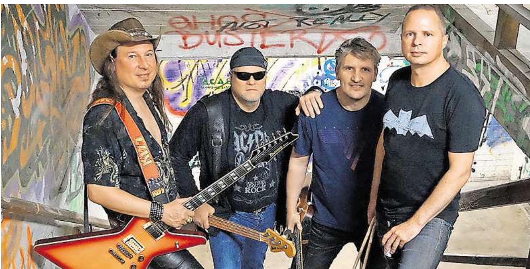
Hard'n Blue liefern erstklassige Classic Rock-Coverversionen. Absolut partytauglich!