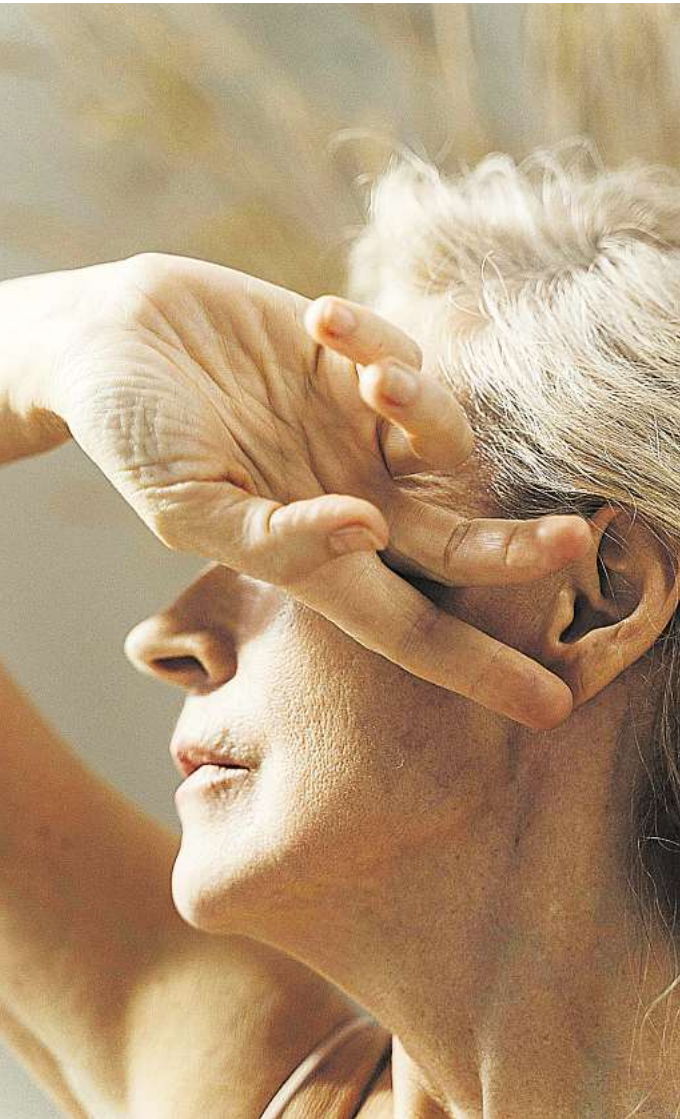
Große Hitze verkürzt langfristig die Lebenserwartung, weil sie Altersprozesse beschleunigt.

Eine Recherche der Plattform Correctiv hatte allerdings 2023 ergeben: Selbst die Landkreise und Städte in Deutschland mit einer überdurchschnittlich hohen Anzahl an Hitzetagen haben keine Konzepte oder Pläne zum Schutz der Bevölkerung. „In der Klimakrise droht nicht nur Wassermangel wie in den vergangenen Jahren, als die Ernten vertrockneten und einige Gemeinden ihr Wasser rationieren mussten“, heißt es in der Veröffentlichung von Correctiv: „Viele Menschen werden an Hitzetagen erneut um ihr Leben bangen.“