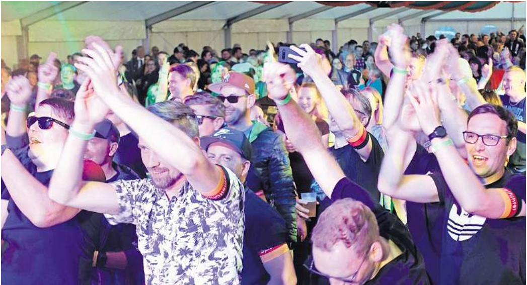
Die Mallorca-Partys beim Schützenfest in Osterwald Unterende haben in der Region schon einen legendären Ruf.