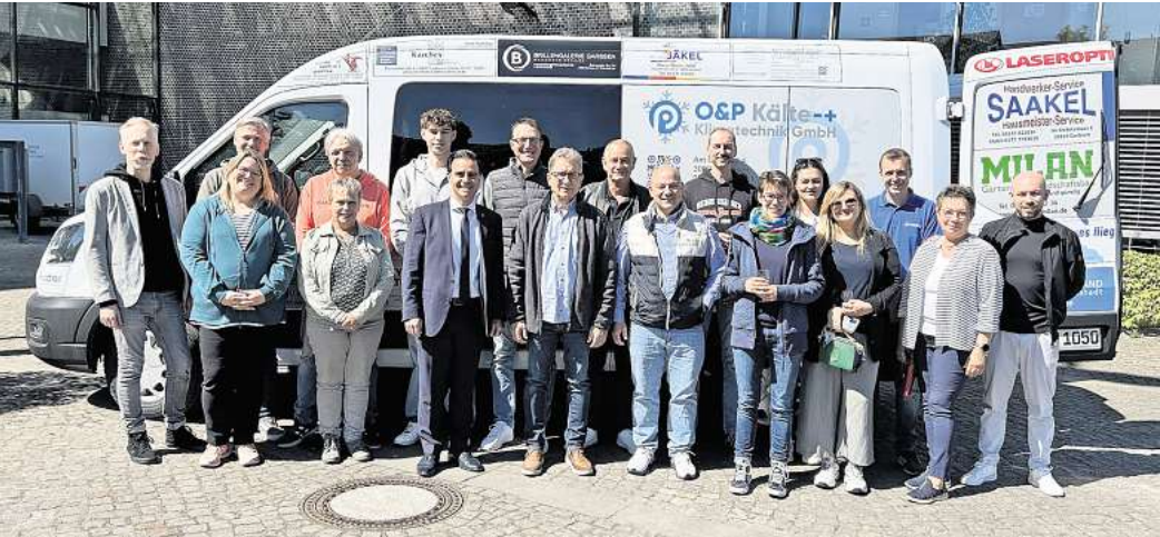
Das neue Citymobil wird in der Jugendpflege vielseitige Einsatzgebiete finden.