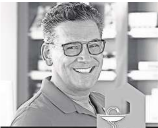
Dr. Erdals Gesundheitstipps

Bei Brustentzündungen wird grundsätzlich zwischen bakteriellen und nicht-bakteriellen Formen unterschieden. Haupt-ursacher der bakteriellen Mastitis ist Staphylococcus aureus, eine weit verbreitete Bakterienart, die bei vielen Menschen als Teil der normalen Flora auf Haut und Schleimhäuten siedelt, ohne bei ihnen zu Erkrankungen zu führen. Normalerweise bilden Haut und Schleimhäute eine natürliche Barriere für Staphylococcus aureus. Eine