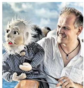
Das Duo Fusion ist vor zwei Jahren Weltmeister geworden und hat 28 Weltrekorde aufgestellt.