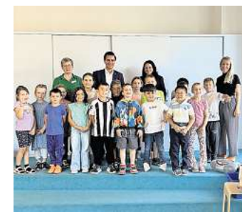
Lesetaschen-Aktion in der Stadtbibliothek: Schulanfänger entdecken die Freude am Lesen.