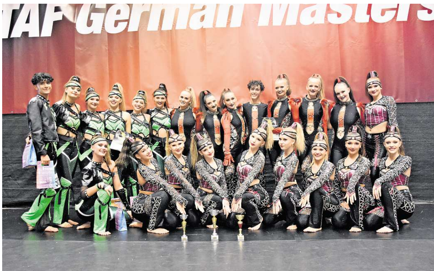
Auf dem Foto sind die drei Smallgroups zu sehen. Oben links in grün „Bold“, oben rechts in rot „Drift“ und unten mittig „Blackout“.

Bei den Junioren erkämpfte sich die Smallgroup „Blackout“ einen Platz auf dem Siegerpodest und freute sich verdient über die Bronzemedaille. Die Kindergruppe „Bliss“ präsentierte sich mit viel Herz und Können und erreichte in einem beeindruckenden Show mit dem Musical „Der geschenkte Gaul“ einen 7. Platz.