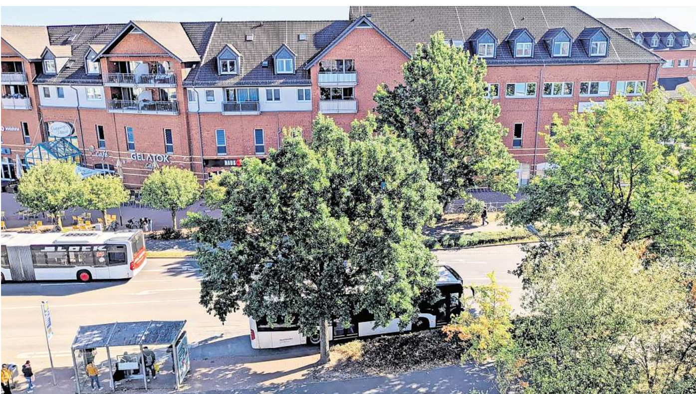
96-Millionen-Euro-Projekt: Nach der etwa dreijährigen Bauzeit sollen die Stadtbahnen künftig an der Berenborsteler Straße zwischen Rathaus und Shopping-Plaza starten und enden.

„Die neue Endhaltestelle soll ein architektonisches Ausrufezeichen setzen“, sagt Garbsens Stadtbaurat Olaf Freitag. „Mit