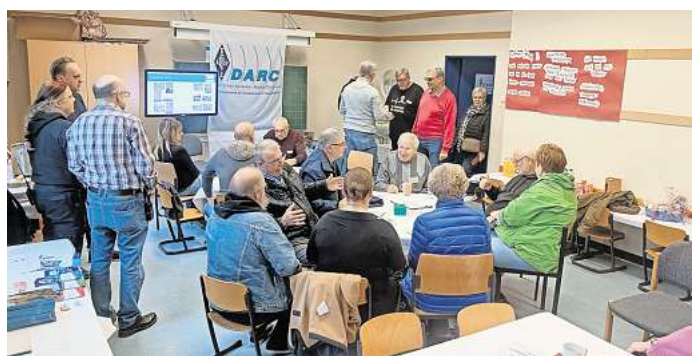
Die Amateurfunker standen für Fragen und Gespräche bereit. Wer sich für den Einstieg in das Hobby interessiert, konnte sich direkt über die Ausbildung zum Funkamateure oder die vielfältigen Aktivitäten im Ortsverband informieren.

den Einblick in die Welt des Amateurfunks erhalten. Es wurden Filme und Dokumentatio-