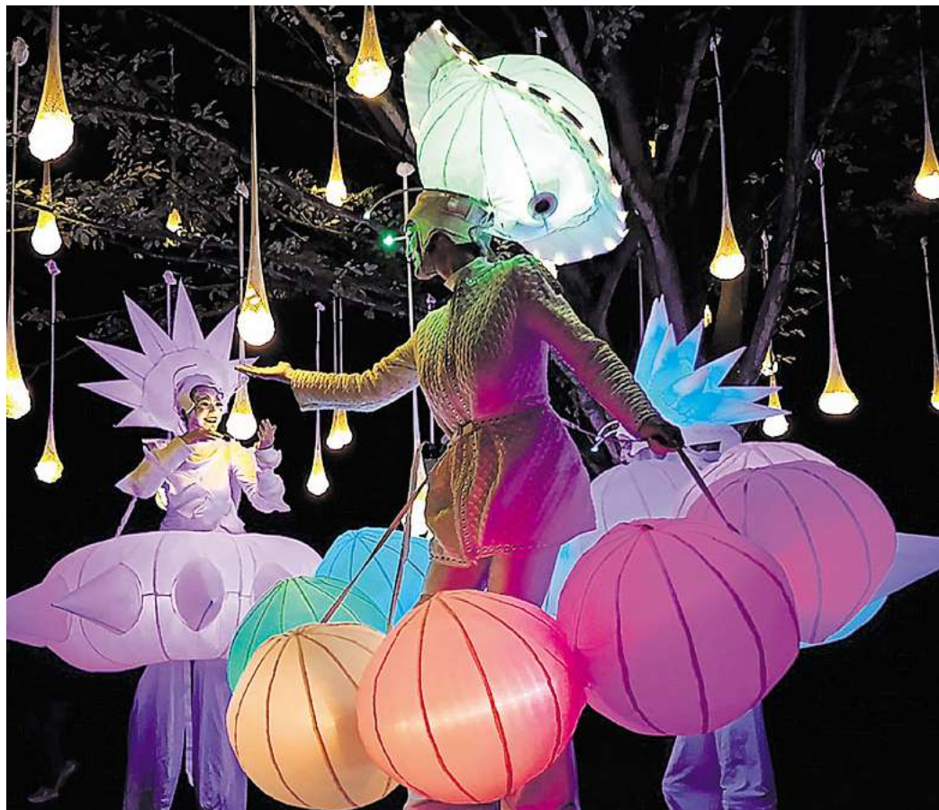
Faszinierende Lichtgestalten: Die Künstlerinnen und Künstler von Oakleaf Stelzenkunst ziehen die Blicke auf sich.

Punsch und Keksen sowie das beliebte Kinderschinken von MK Immobilien machen den Abend zu einem echten Familienfest. Für Entdeckerinnen und Entdecker bietet das Heimatmuseum Seelze mit „Gut behütet“ eine spannende Sonderausstellung. Zusätzlich lädt das Museum zu einer Märchenlesung, zu Aktionen der Schauspielgruppe „Die Zeitreisenden aus Seelze“ rund um ihren „leuchtenden Kupferkessel“ sowie zum Besuch seiner großen