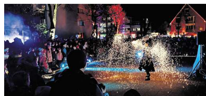
Die Künstlerinnen und Künstler von Elements of Fire zeigen auf dem Rathausplatz eine atemberaubende Show.