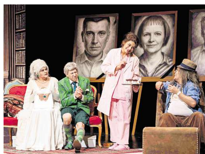
Das Kulturbüro Garbsen bringt am Samstag, 22. November, „Ewig jung“ auf die Bühne in der Aula im Schulzentrum I.

Ein Theater in einer nicht näher definierten Zukunft: Der Betrieb ist eingestellt, doch das Ensemble ist noch da – und hat jede Menge Spaß! Eine Handvoll hochbetagter Schauspieler nutzt die Räumlichkeiten als Altersresidenz. Hier sitzen sie auf der Bühne zusammen und