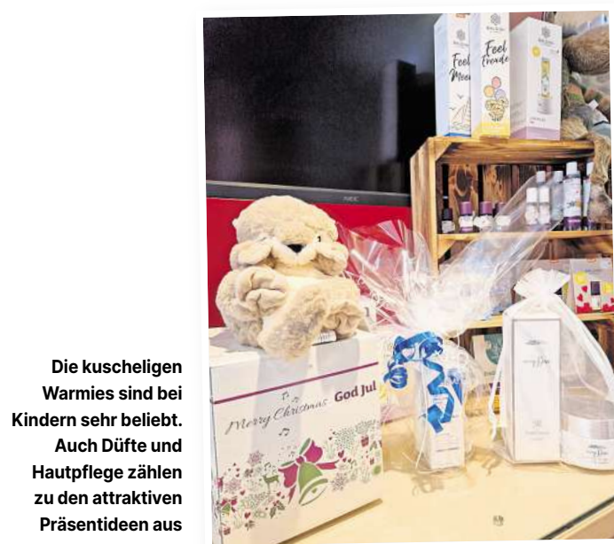
Die kuscheligen Warmies sind bei Kindern sehr beliebt. Auch Düfte und Hautpflege zählen zu den attraktiven Präsentideen aus der Apotheke.

kommt da genau richtig. Auch Lippenpflege ist gefragt, damit man während des Schlittschuhlaufens, Rodelns oder Skifahrens geschmeidige Lippen behält und auch sie vor gut vor dem Frost schützt.