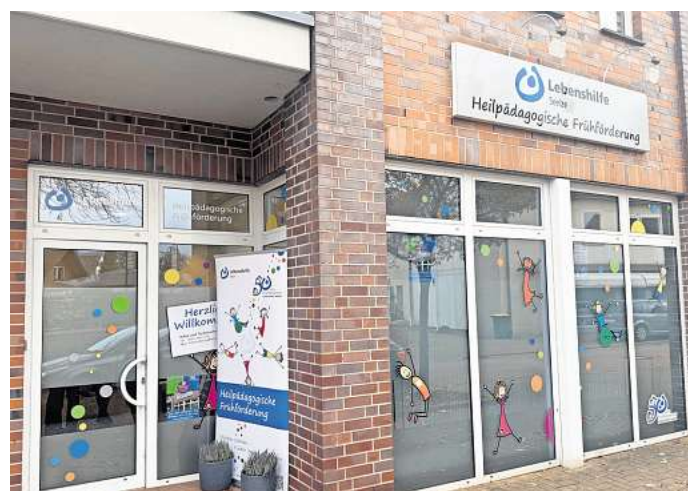
Im Zentrum Seelzes befindet sich jetzt die neue Frühförderstelle der Lebenshilfe.

Seit Anfang der 2000er Jahre arbeitet die Frühförderung der Lebenshilfe eng mit Kitas in der Region zusammen. Viele Kinder werden dort begleitet, wo sie einen großen Teil ihres Tages verbringen – in der Gruppe, im Spiel, im Kontakt mit anderen. Für die Zukunft wünscht sich Lu-