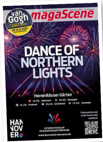
Stadtmagazin für Hannover magaScene

Das Publikum stimmt nach jeder Vorstellung - Silvester und Neujahr sind spielfrei - per Kreuzchen oder App über seine persönlichen Favoriten ab. Zusammen mit der Gilde Brauerei stellt der Circus den drei besten Acts Preisgelder