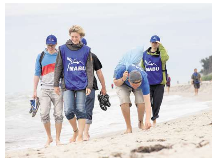
In über 200 NABU-Gruppen in Niedersachsen tragen Freiwillige Verantwortung für Biotope, bauen Amphibienschutzzäune auf, kartieren Bestände diverser Arten, pflegen Streuobstwiesen und organisieren Umweltbildungsangebote.

In über 200 NABU-Gruppen in Niedersachsen tragen Freiwillige Verantwortung für Biotope, bauen Amphibienschutzzäune auf, kartieren Bestände diverser Arten, pflegen Streuobstwiesen und organisieren Umweltbildungsangebote. Sie sind damit Rückgrat und Herzstück des Verbandes. Ihr Einsatz zeigt: Naturschutz lebt vom aktiven Mitmachen und davon, gemeinsam für