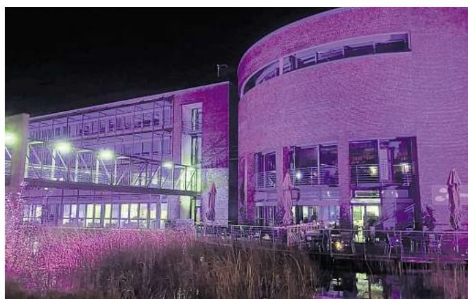
Internationaler Tag der Menschen mit Behinderung: Stadt Garbsen hat ein klares Zeichen gesetzt - das Rathaus erstrahlte in Lila.

Ein Praktikum kann dabei helfen, Unsicherheiten abzubauen und herauszufinden, ob eine Tätigkeit bei der Stadt Garbsen passt. „Unsere Erfahrungen zeigen, dass Praktika oft der erste Schritt in eine erfolgreiche Zusammenarbeit sind“, sagt Dirk