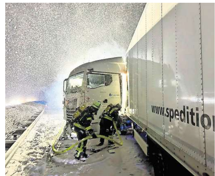
Ein brennender Lastwagen auf der A2 behinderte am Freitag bei schwerem Schneetreiben den Verkehr.

schnell gelöscht werden. Auch die Rückfahrt von der Einsatzstelle zu den Feuerwehrhäusern gestaltete sich aufgrund der Wetter- und Verkehrslage schwierig und nahm viel Zeit in Anspruch.