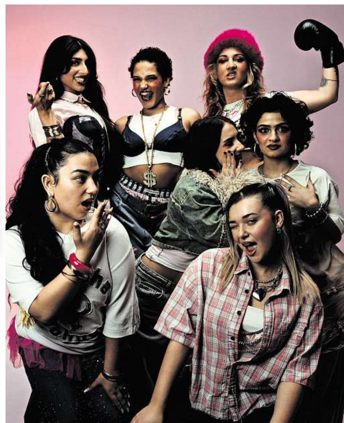
Das Brujas Collective lädt am 1. Februar zum „Ready To Be Soft Battle“ ins Neue Rathaus.

Viele weitere, spannende Neuigkeiten aus der lokalen Kulturszene finden Sie in der aktuellen Ausgabe unseres Partnermediums magaScene, monatlich frisch gedruckt und kostenlos an über 500 Auslegestellen in Hannover oder online auf www.magaScene.de inklusive Download-Möglichkeit.