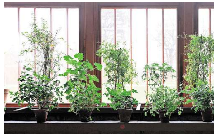
Wie geht's den Pflanzen in ihrem Winterquartier? Wer keine Überraschungen erleben will, sollte das regelmäßig kontrollieren.

Ein hellgrüner Austrieb: Wenn die Pflanzen anfangen auszu-treiben, ist das ein Zeichen dafür, dass sie nicht kalt genug stehen und der Stoffwechsel nicht zur Ruhe kommt. Daher unbedingt einen sehr dunklen, kalten Standort wählen, die Tempera-