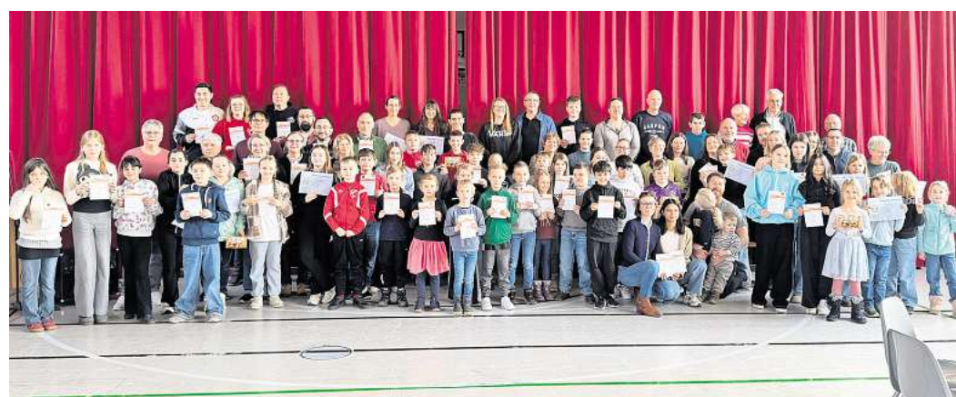
Stolz präsentieren die zahlreichen Teilnehmer des Sportabzeichens beim TV Lohnde ihre Urkunden.