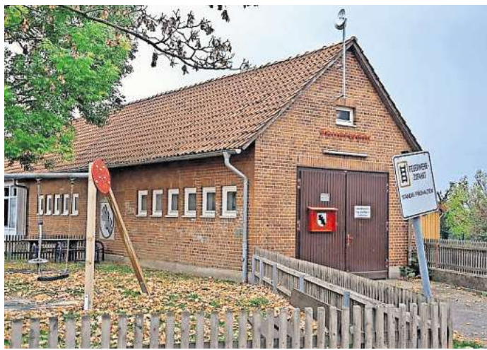
Viel zu klein: Das Feuerwehrhaus in Döteberg bietet nicht mehr genug Platz und entspricht nicht den aktuellen Bestimmungen.

SEELZE. Es sind gute Nachrichten, die die Stadt Seelze aus dem niedersächsischen Innenministerium erreicht haben: Als finanzschwache Kommune eingestuft, bekommt die Kommune 1,6 Millionen Euro als Zuschuss für den rund 3,5 Millionen Euro teuren Neubau des Feuerwehrhauses in Döteberg. Das Geld stammt aus dem Bedarfszuweisungsfonds des Landes. Insgesamt bezuschusst Niedersachsen daraus mit 18,6 Millionen Euro 30 besonders finanzschwache Kommunen, die den Betrag in den Brandschutz investieren. „Mit diesem Geld wird die Einsatzfähigkeit der Feuerwehren im Land und das Engagement ihrer Mitglieder nachhaltig gestärkt. Dies trägt zu unserer Sicherheit bei“, so die niedersächsische Innenministerin Daniela Behrens (SPD). „Wir haben uns total darüber gefreut“, sagt Seelzes Stadtbaurat Dirk Perschel. Baubeginn im Sommer Bereits in diesem Sommer soll in Döteberg der erste Spatenstich erfolgen und mit dem Neubau des Feuerwehrhauses begonnen werden. Das Gebäude wird am östlichen Ortsrand an der Ecke Dorfstraße/Hinterm Kampe entstehen. Bereits 2023 hatte die Stadt Seelze das Grundstück erworben. Die neu gebauten Feuerwehrhäuser in Otternhagen und Leveste haben Vertretern von Stadtfeuerwehr, Ortsfeuerwehr und der Seelzer