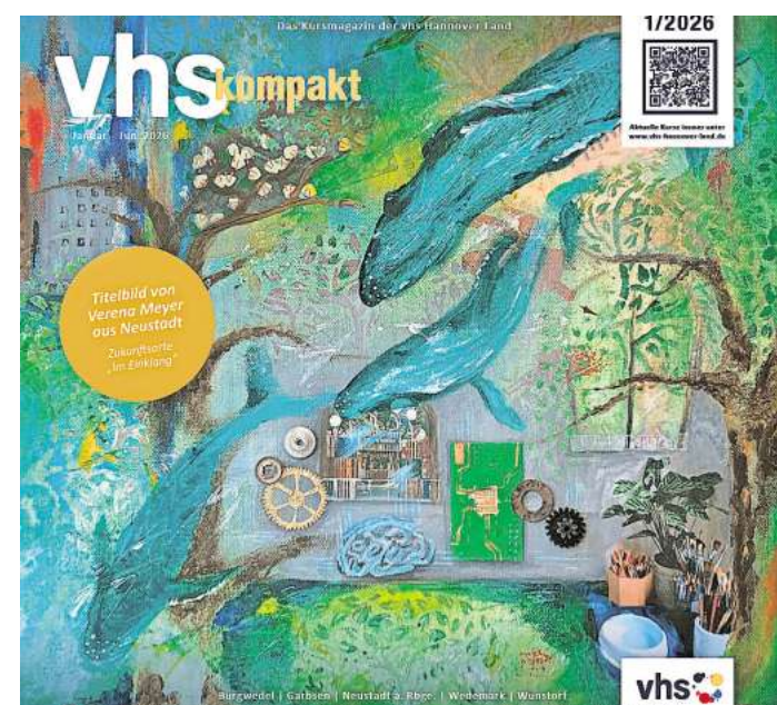
Das neue Programm der vhs Hannover Land liegt an zahlreichen Auslageorten in Garbsen aus und kann in der vhs-Geschäftsstelle am Planetenring 35 abgeholt werden.

Ergänzend erleichtern Bildungsurlaube und Online-Angebote den souveränen Umgang mit Office 365 oder Künstlicher Intelligenz. Weitere Informationen und Anmeldungen telefonisch unter (05032) 9014422, per E-Mail an info@vhs-hannover-land.de oder online über www.vhs-hannover-land.de .