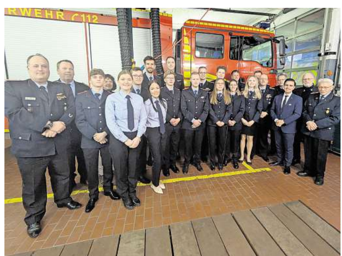
Die Feuerwehr Osterwald Unterende blickt auf ein erfolgreiches Jahr zurück.