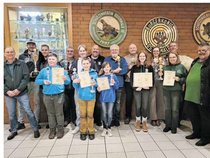
Die erfolgreichen Schützinnen und Schützen des Schützenvereins Osterwald Oberende nach dem Pokalschießen.