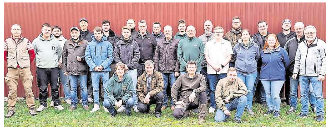
Die Teilnehmer des Waffensachkundekurses des KSSV Neustadt am Rübenberge.

Damit jeder Schütze mit den von ihm benutzten Waffen so umgehen kann, dass durch deren Handhabung keine Gefahr ausgeht, wurde den Lehrgangsteilnehmern in 30 Unterrichtseinheiten das erforderliche Wissen über Waffentechnik und waffenrechtliche Vorschriften vermittelt. Außer dem praktischen Schießen mit Kurz- und Langwaffen unter Aufsicht der Ausbilder auf dem Schießstand des Schützenvereins Osterwald Unterende lernten die Teilneh-