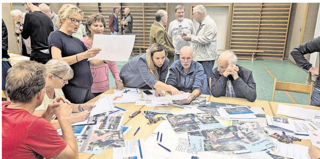
Abschluss der Ortsentwicklungskonzepte: Bei den Planungswerkstätten – wie hier im September in Harenberg (Foto) – brachten zahlreiche Bürgerinnen und Bürger ihre Ideen für die Ortsentwicklung ein. Bei den bevorstehenden Abschlussabenden in Dedensen und Harenberg stellt die Stadt Seelze nun die gemeinsam erarbeiteten Ziele und Vorhaben vor.

Bereits bei den Auftaktveranstaltungen im April 2025 sowie in den Planungsworkshops im