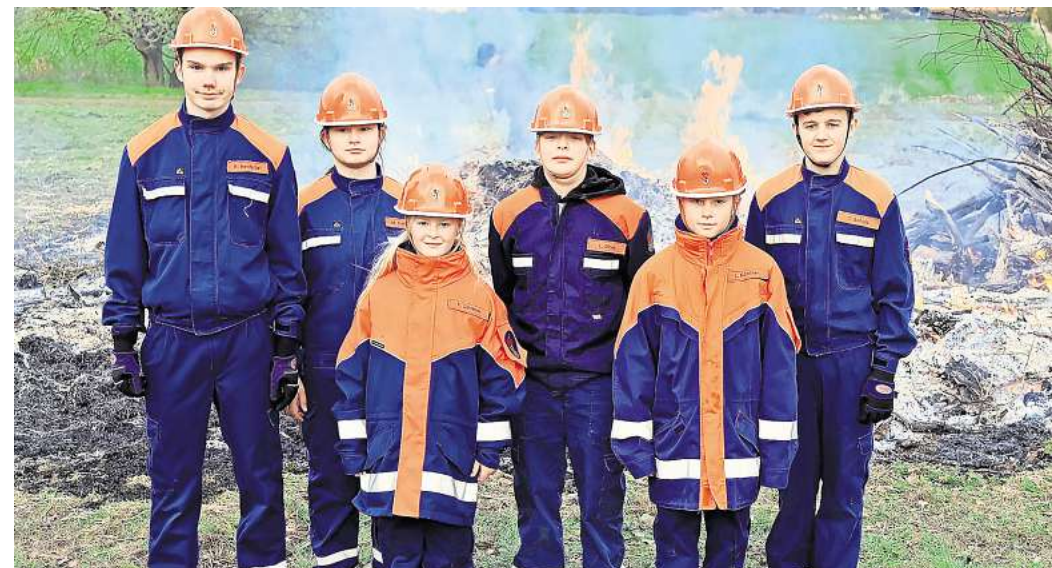
Großes Feuer: Auch wenn das trockene Holz in Dedensen sehr schnell abgebrannt ist, beaufsichtigen die Mitglieder der Jugendfeuerwehr das Feuer bis zum Schluss. Anwesend sind (von links) Ryan (16), Meghan (11), Fenja (10), Leonhard (11), Linus (10) und Tom (14).

satzes der Ortsfeuerwehr konnte so die schöne Tradition des Osterfeuers weiterhin erhalten bleiben.