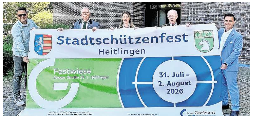
Das Garbsener Stadtschützenfest findet dieses Jahr in Heitlingen statt.