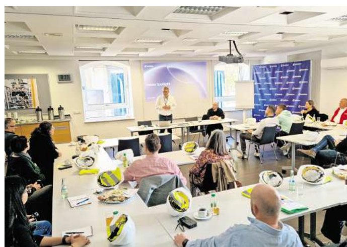
Beim Ausbildungsfrühstück der städtischen Wirtschaftsförderung kommen regelmäßig Ausbilderinnen und Ausbilder sowie Vertreterinnen und Vertreter von Schulen und weiteren Institutionen zum informativen Austausch bei frischen Brötchen und Kaffee zusammen.

puls-vorträge aus dem Bereich der Lebenshilfe, über „Azubis aus Madagaskar“ und Pflegeberatung für Mitarbeitende freuen. Danach bleibt Zeit, Erfahrungen rund um Ausbildung und Praktika auszutauschen und neue Einblicke sowie Antworten auf wichtige Fragen zu erhalten. Anmeldungen für die kostenlose Teilnahme an dem rund zweistündigen Ausbildungsfrühstück nimmt die städtische Wirtschaftsförderung bis Montag, 22. Juni, per E-Mail an wirtschaftsfoerderung@stadt-seelze.de oder telefonisch unter (05137) 828410 entgegen. Veranstaltungsort ist der Schulungsraum im Werk 4 der Lebenshilfe für Menschen mit Behinderung Seelze e.V., Herberburger-Platz 1.