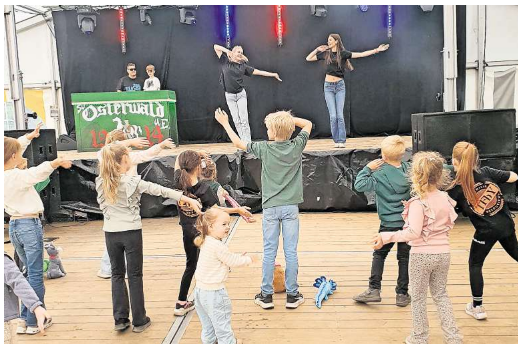
Bei der Kinderdisco hatten die Jüngsten viel Spaß.

für Kleintiere von Samstag 12 Uhr bis Montag 7 Uhr, Telefon (05031) 3435.