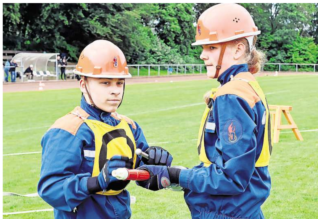
Wettbewerb Teil A: Zwei Teilnehmer bauen einen Löschangriff auf.

lassenheit im Sommerzeltlager. Für viele der Kinder- und Jugendfeuerwehren geht es in diesem Jahr ins Regionzeltlager nach Bokeloh.