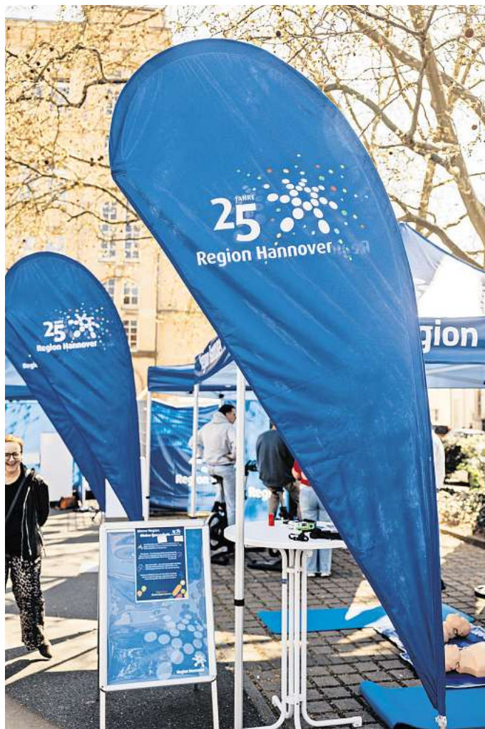
Die Roadshow kommt auf den Rathausplatz.

Doch auch abseits der Spiele lohnt es sich, vorbeizuschauen. Die Region Hannover bringt Experten aus verschiedenen Bereichen mit, um vor Ort zu informieren, zu beraten und Fragen direkt zu beantworten. In Garbsen bieten die Sozialexperten der Region die Möglichkeit, mehr über die Angebote der Be-