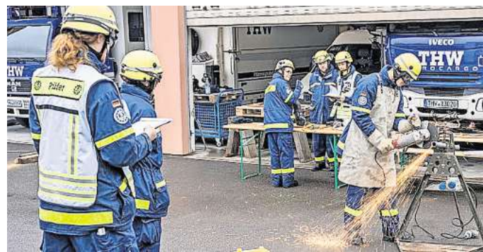
Das THW startet am 19. August mit der neuen Grundausbildungsgruppe in Wunstorf.

Wer kann mitmachen? Eigentlich jeder aus Garbsen, Neustadt und Wunstorf. Im THW engagieren sich Frauen und Männer ab 18 Jahren, ohne Altersgrenzen,